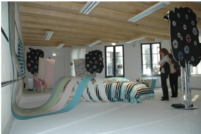
Christian Lacroix pour la redoute. Prod Parti pris

La salle 2, d'une surface de 93 m 2 accueille un maximum de 70 personnes assises. Facilement occultable elle est idéale pour vos vidéoprojections et conférences.