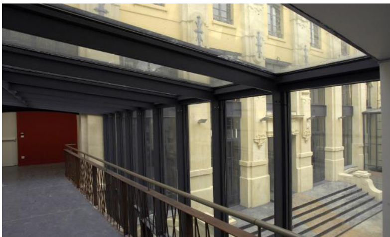
La passerelle menant aux salles 3 et 4 du Pavillon